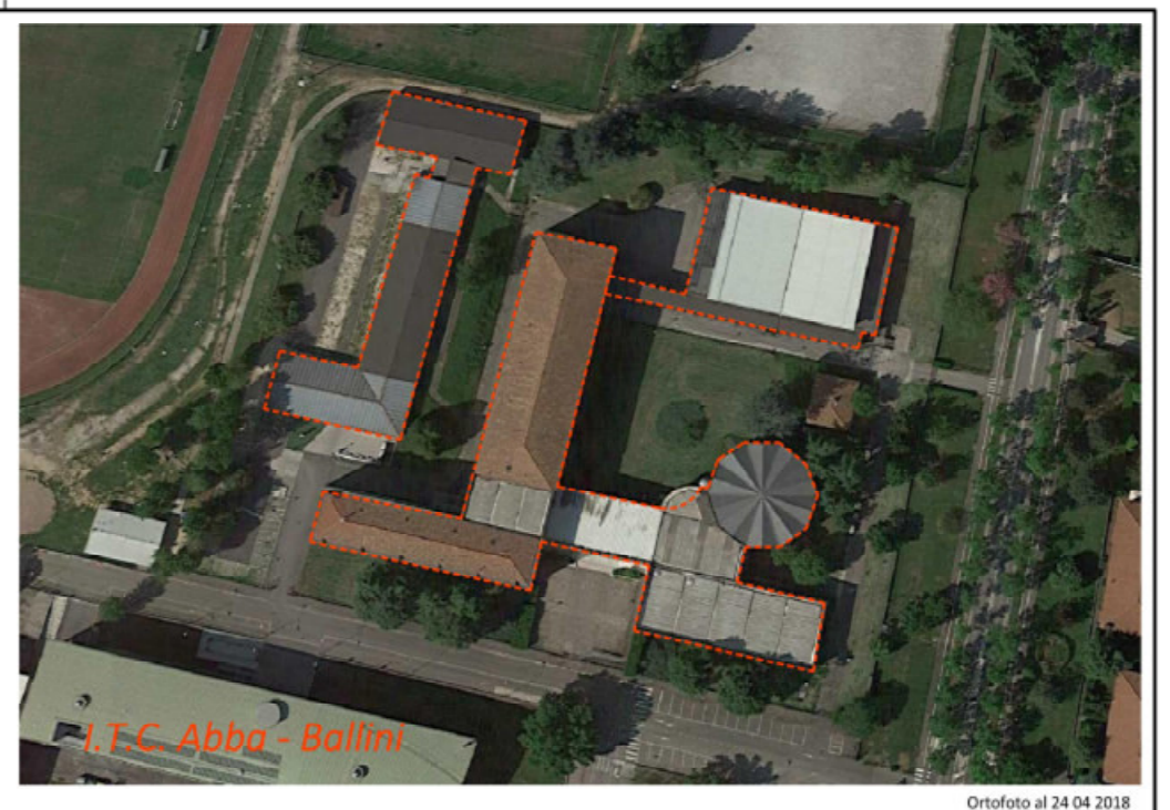
Ortofoto al 24/04/2018